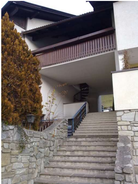
Fig. 1 – veduta esterna ingresso civ. 33