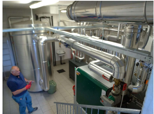
Fig. 2 – veduta d'insieme locale centrale termica