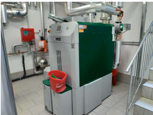
Fig. 3 – unità termica alimentata a pellet