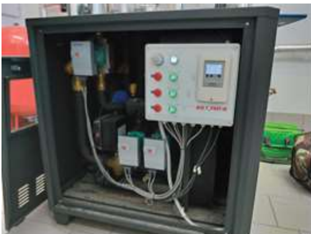
Fig 5 - gruppo scambiatori